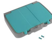
Deckel mit Stauraum für 120 L Sackhalter